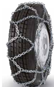
pewag austro super reinforced