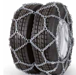
pewag austro super reinforced twin