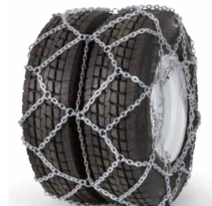
pewag austro super twin