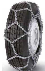
pewag austro super